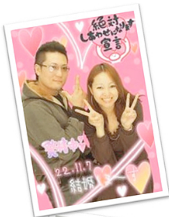
ベビフェ久留米店にて サプライズ後の二人。